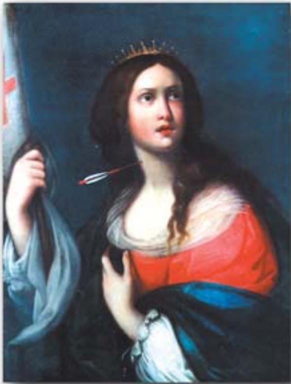
"Sant'Orsola", dipinto su tela

Fra il 1200 e il 1500 si diffusero alcune confraternite chiamate "navicelle di S.Orsola", fra le quali, probabilmente, il primo nucleo di quella che sarà la Misericordia di Pisa. Gli adepti si impegnavano a compiere opere buone, partecipavano a Messe e preghiere, nella speranza di compiere felicemente, con questi meriti e con la pro-