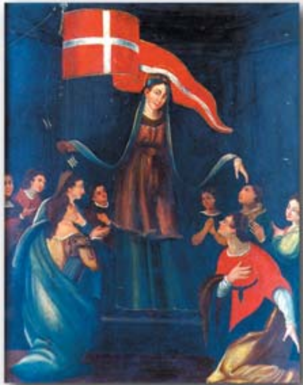
"Sant'Orsola e le sue compagne", dipinto su ardesia

tezione di S.Orsola, il viaggio verso il Paradiso.