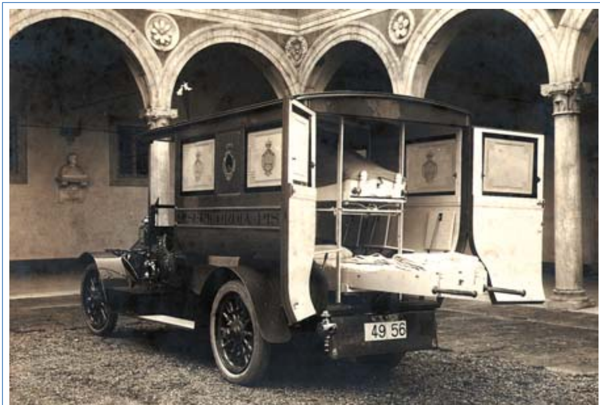
Come eravamo. 1901: Un'ambulanza della Misericordia nel chiostro dell'Arcivescovo

Dalla Residenza Magistrale, 1 Luglio 1956