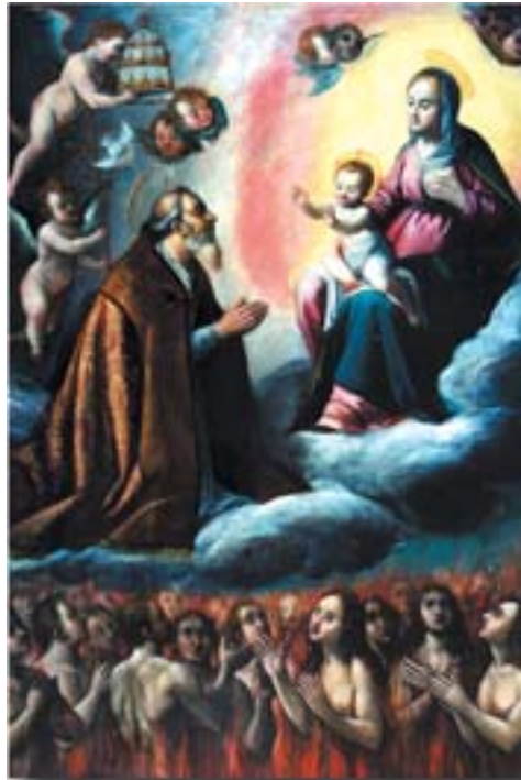
La "Messa di San Gregorio"

In attesa che una specifica mostra possa permettere il godimento a tutta la cittadinanza, anticipiamo la loro visione presentando le tele raffiguranti i due santi che per storia e tradizione sono particolarmente legati alla Misericordia di Pisa: San Gregorio Magno e Sant'Orsola.