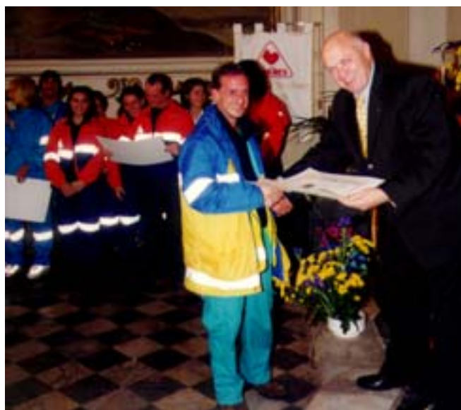
Il Governatore premia i Volontari