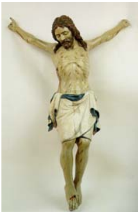
Crocifisso di Francesco di Valdambriano XV secolo, primo decennio Chiesa della Misericordia, Pisa

"[...] Il decreto 21 marzo 1785 di soppressione delle Confraternite laicali in Toscana, emanato da Pietro Leopoldo I, fu applicato alla nostra Confraternita il 10 luglio successivo. Il 14 dicembre era profanato l'Oratorio, come risulta dagli Atti Straordinari della Curia Arcivescovile riguardanti quell'anno. Se non è possibile documentare l'inevitabile dispersione dei sacri arredi appartenuti all'Oratorio, ci resta notizia delle vive premure fatte dalla Confraternita per riave-