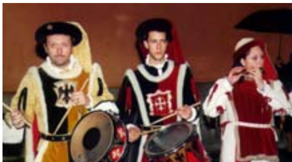
I musicisti del Gioco del Ponte

la Provincia di Pisa), ed hanno assistito ad una breve simulazione di attivazione.