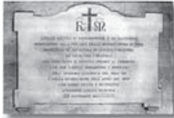
Lapide apposta nel 1899 nel Chiostro di S. Francesco in memoria dei Fratelli della Misericordia di Pisa ivi sepolti.

la inondazione dell'Arno del 1869 con animo grato e reverente apposero questa memoria. XIX novembre MDCCCXCIX".