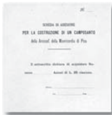
Scheda di Adesione per la costruzione di un Camposanto della Arciconfraternita della Misericordia di Pisa.