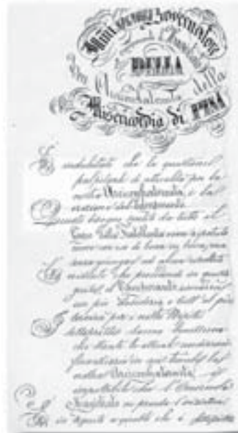
La prima pagina della Istanza inviata al Magistrato il 2 gennaio 1875 da 283 fra Conservatori, Confratelli e Capi di Guardia per realizzare un Camposanto dell'Arciconfraternita.

“È indubitato che la questione palpitante di attualità per la nostra Arciconfraternita è la erezione del Camposanto. Questo bisogno, sentito da tutto il corpo della Fratellanza, viene ripetuto come un'eco di bocca in bocca, ma senza giungere ad alcun risultato. È evidente che procedendo in questa guisa, il camposanto rimarrà un pio desiderio, e tutt'al più servirà per i nostri nipoti. I sottoscritti sanno benissimo stante le attuali condizioni finanziarie in cui trovasi la nostra Arciconfraternita, è impossibile che l'Onorevole Magistrato prenda l'iniziativa. È in seguito a questo che i sottoscritti sarebbero venuti nella deliberazione di costituirsi come Promotori per raccogliere oblazioni dallo intero Corpo della Fratellanza. E per far ciò fanno rispettosamente istanza alle SS.LL.Ill.me affinché si vogliano degnare di accordare loro il permesso di aprire delle note di sottoscrizioni. Al superiore accorgimento del nostro egregio magistrato non sfuggirà il noto proverbio che dice il ferro va battuto quando è caldo. In questo momento la Fratellanza tutta è entusiasmata per