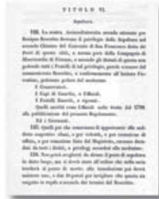
Dal Regolamento della Misericordia di Pisa del 1848.

"Cinque secoli di benemerenze e di sacrifici meritavano alla Ven. Arc. della Misericordia privilegio di sepoltura in questo Chiostro, ed oggi che i Fratelli qui tributano il dovuto premio ai generosi che per carità sfidarono i pericoli dell'epidemia colerica del 1854-55 e del-