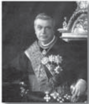
1930. Foto ufficiale del Cardinale Maffi con il Collare della SS. Annunziata e numerose altre importanti onoreficenze italiane e straniere.

Misericordia un appezzamento di terreno per la erezione di un Cimitero. Con tale atto generoso, il munifico Sig. Avvocato Morghen interpreta il pensiero e compie un voto anche dei suoi cari e alla donazione non appone che lievi condizioni, che certamente saranno accettate, e delle quali in un prossimo convegno, ch'Essa vorrà fissare, farò relazione. E rallegrandomi di questo fatto, che onora altamente il donatore e che alla Venerabile Arciconfraternita consentirà il conseguimento di disegni da lungo tempo meditati, con ossequio profondo mi professo 77 .