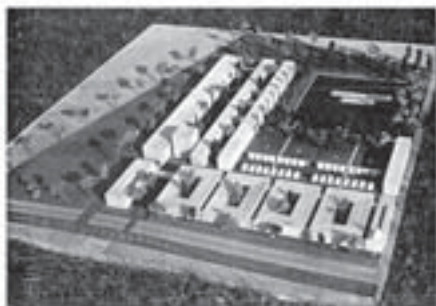
Il Plastico del Camposanto della Misericordia di Pisa.